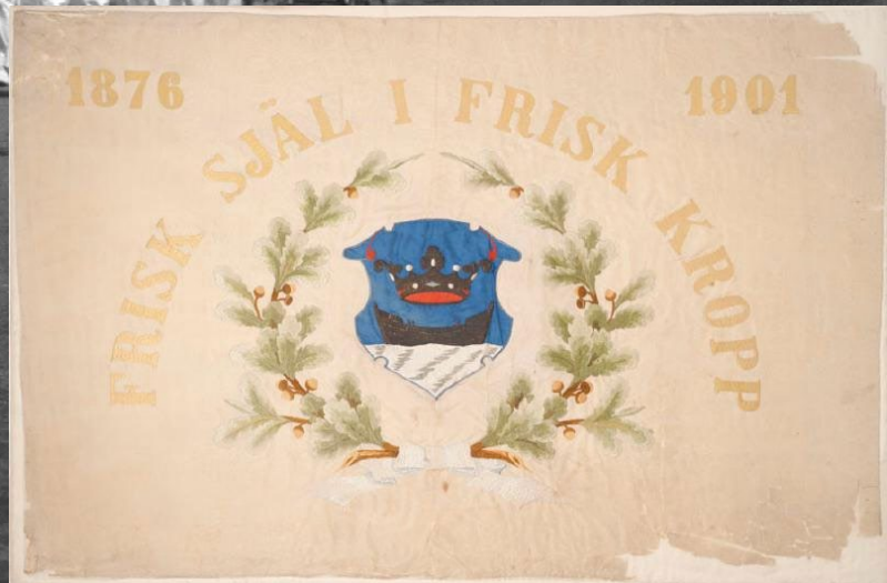
Gymnastikföreningen för Fruentimmer i Helsingfors