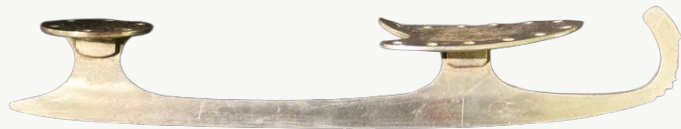
Ludowika Jakobssonin luistimen terä, noin 1920